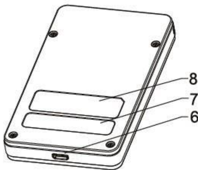
Figura 2. Visão traseira