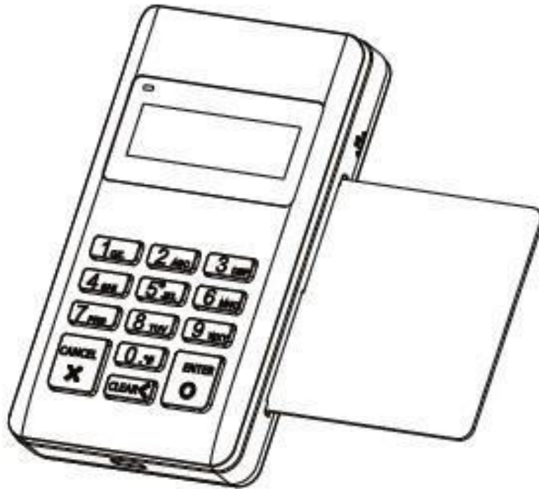
Figure 3. Inserindo do cartão com chip

Antes de inserir o cartão, cheque dentro e fora do leitor. Caso haja qualquer objeto suspeito, não proceda com a inserção e avise imediatamente o responsável pelo terminal.